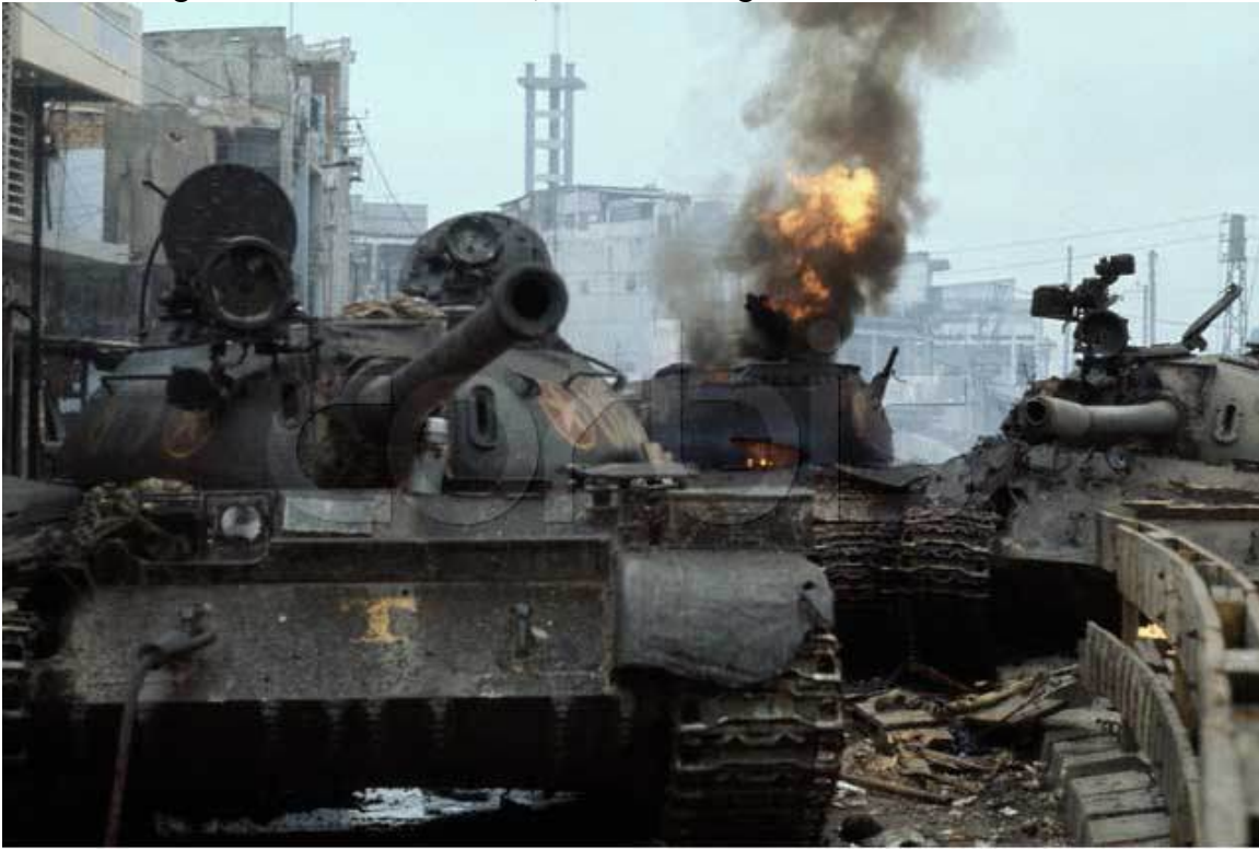
ARVN Commandos knocked down Viet Cong T-54s on Trương Minh Giảng street. The tower on backdrop is "Ba Chuong" church

sẵn sàng nhận tội và tôi sẽ đi đầu, nếu Việt Cộng có bắn thì họ sẽ bắn tôi trước”.